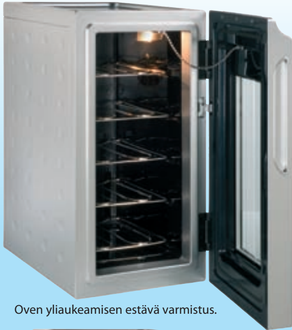
Oven yliukeamisen estävä varmistus.